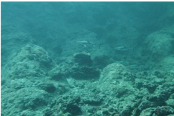
Requin dans l'arche