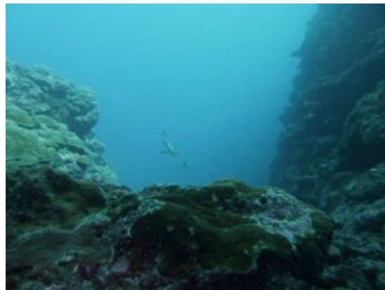
Dos à l'arche, vue vers le fond, on arrive de la droite

Si pas de requin, on peut descendre au Sud à 40-50mètres pour voir les requins. Belles gorgones à l'aplomb de l'arche, au fond