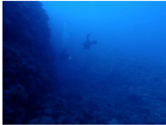
Dernier virage à gauche avant l'arche